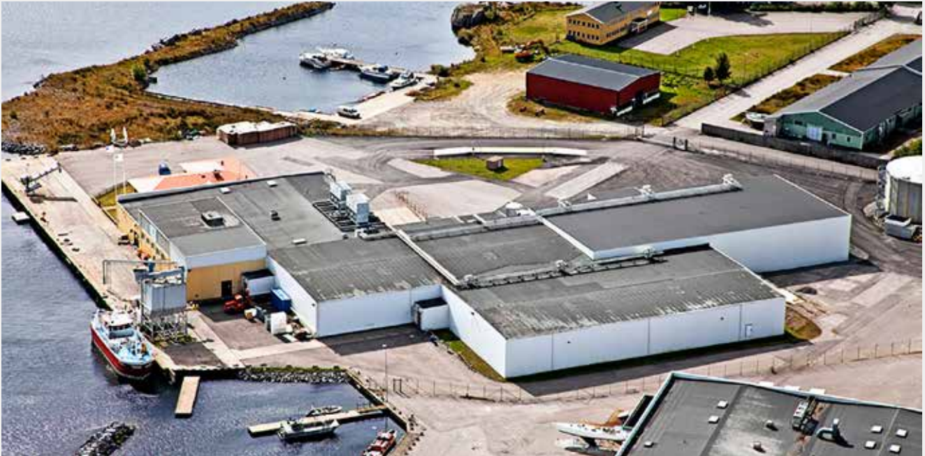
"Sweden Pelagic Västervik AB", hvor "FF Skagen A/S" er 50 pct. medejer, som FF også er i de to øvrige virksomheder, "Sweden Pelagic Gotland AB" og "Sweden Pelagic Ellös AB".