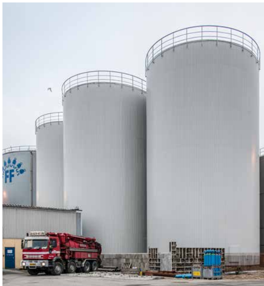
Nye højisolerede olietanke hos FF giver mulighed for opvarmning af olie – både den, der skal renses – og den rensede klar til afskibning.