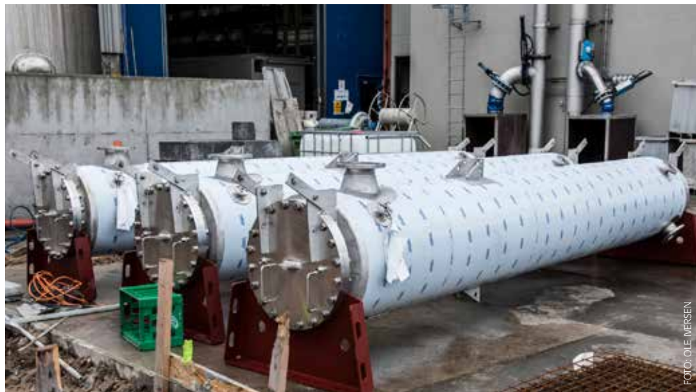
Nye varmevekslere til kogeriet medvirker til at effektivisere separationsprocessen.

- Vi er klar over, at FF Skagen har en position i Skagens erhvervsliv, som også byens borgere glæder sig over, og i Danmark og internationalt er vi desuden kendt som en af de førende i branchen.