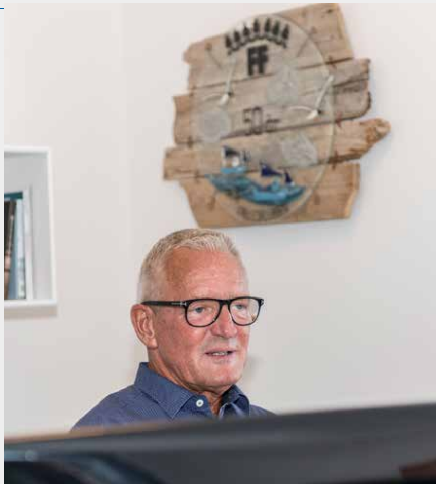
Konsolidering set i et økonomisk perspektiv er vigtig i en koncern som vores. Også på det felt står vi stærkere end nogensinde, og det er nødvendigt i en voksende international branche.

- Det gik for alvor stærkt i FF i løbet af 1980'erne nogle år efter, at jeg blev ansat. - Dengang i 80'erne var vi tre, som i dyb hemmelighed gennem flere måneder førte forhandling om at overtage den store konkurrent i Skagen "Superfos