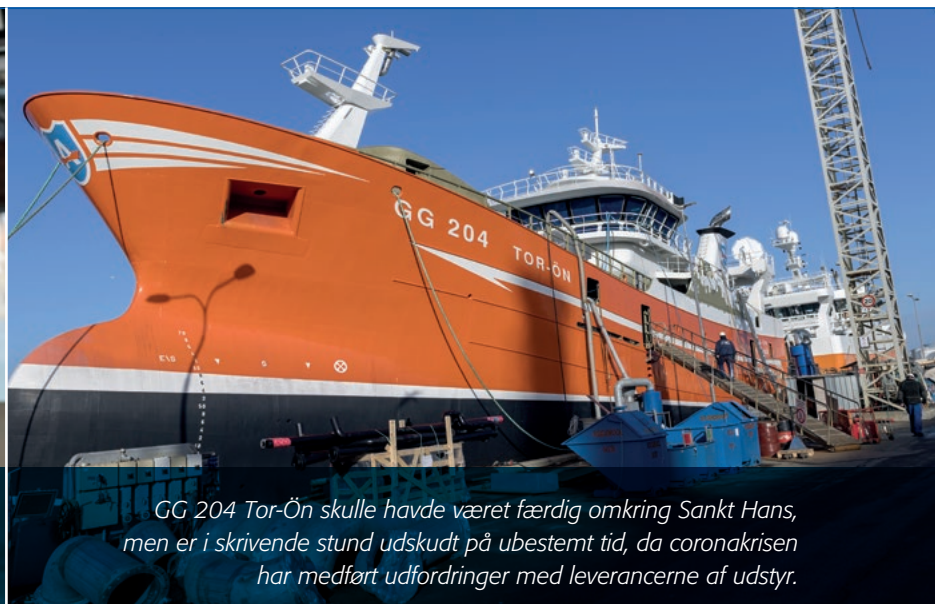
GG 204 Tor-Ön skulle have været færdig omkring Sankt Hans, men er i skrivende stund udskudt på ubestemt tid, da coronakrisen har medført udfordringer med leverancerne af udstyr.