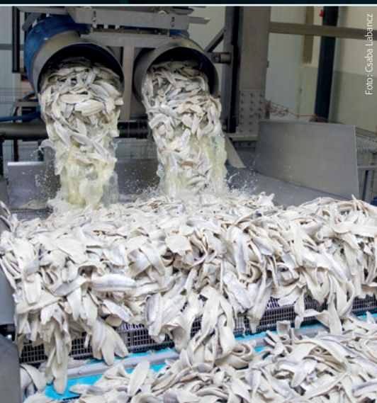
Produktionen i såvel FF Skagen som Scandic Pelagic kører i skrivende stund uændret.