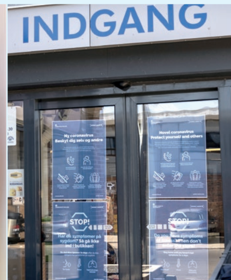
Her ses indgangen til FF Handel butikken.