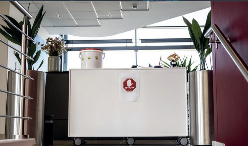
»Af med smitten – på med spritten,« lyder budskabet på spanden med spritservietter ved indgangen til hovedkontoret. Stopskiltet skal sikre, at kun medarbejdere kommer på kontoret.