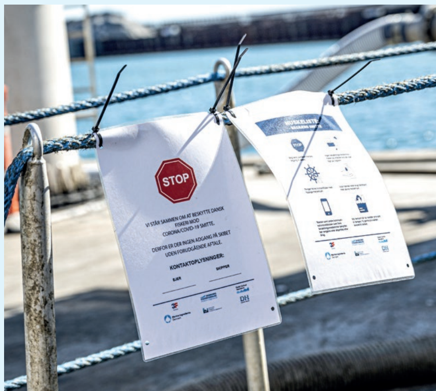
»Vi står sammen om at beskytte dansk fiskeri mod corona/covid-19 smitte,« står der blandt andet på advarselsskiltene på havnekajen.