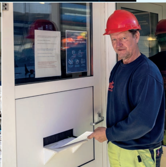
Chaufførerne til fabrikkerne stikker deres papirer gennem en brevsprække for at undgå unødigt kontakt.