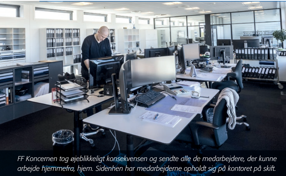
FF Koncernen tog øjeblikkeligt konsekvensen og sendte alle de medarbejdere, der kunne arbejde hjemmefra, hjem. Sidenhen har medarbejderne opholdt sig på kontoret på skift.