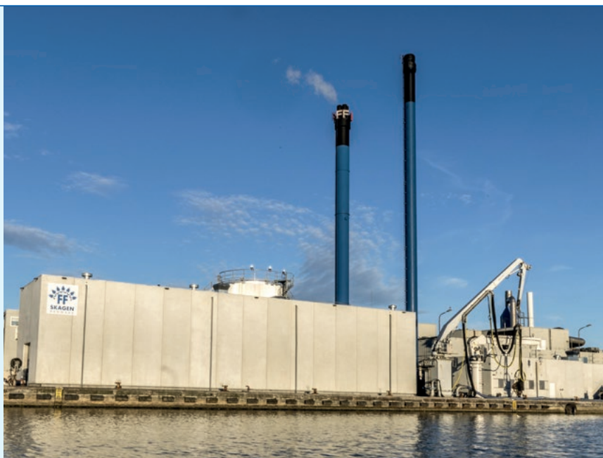
FF Skagens nye losseanlæg blev indviet i 2018.