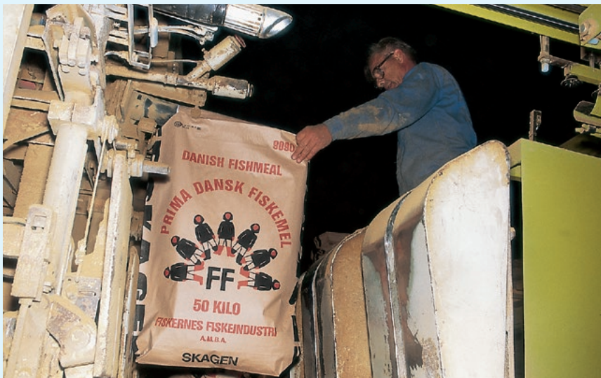
Efterspørgslen efter specialmel var fortsat stigende, og her vises udsækningsmaskinen, der erstattede, at melsækkene skulle fyldes manuelt op med de 50 kg fiskemel!