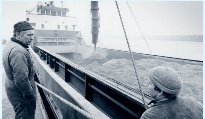
Fiskemel blev lastet direkte ombord på fragtskibene.

fabrikker dreje nøglen. Samlet set faldt antallet af fabrikker i perioden fra 13 til 5. Men i forhold til råvarerne trak FF det længste strå, blandt andet fordi der kom fiskere fra Strandby og Hirtshals, der landede deres fisk til FF.